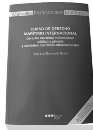
Manual del curso

Va dirigido a todos aquellos abogados que lleven asuntos de derecho marítimo , ya sea a nivel despacho o desde una asesoría jurídica de empresas marítimas , así como a licenciados o graduados en derecho que deseen especializarse y desarrollarse profesionalmente en este ámbito. Por otro lado, también resulta un curso de interés para los ingenieros navales que quieran un conocimiento específico de los instrumentos jurídicos a utilizar en su desarrollo profesional, así como a funcionarios, profesores y, en general, estudiosos involucrados en actividades marítimas, incluyendo a los estudiantes de ingeniería naval y marina civil o militar.