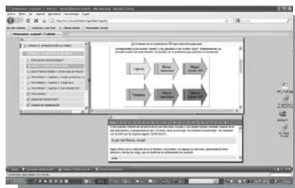
Plataforma de formación on-line IME-learning